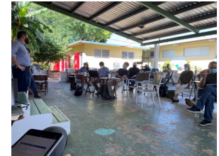
2021 Reunión con las comunidades

Contexto: El Laboratorio Nacional Sandia realizó un análisis conceptual de una solución de microrred para cumplir con los objetivos de sostenibilidad e independencia energética de la isla en 2021, incorporando los comentarios de la comunidad obtenidos durante los talleres locales. Desde entonces, se han identificado fondos de FEMA para construir una microrred. LUMA está tomando la iniciativa en el diseño e implementación de la nueva infraestructura.